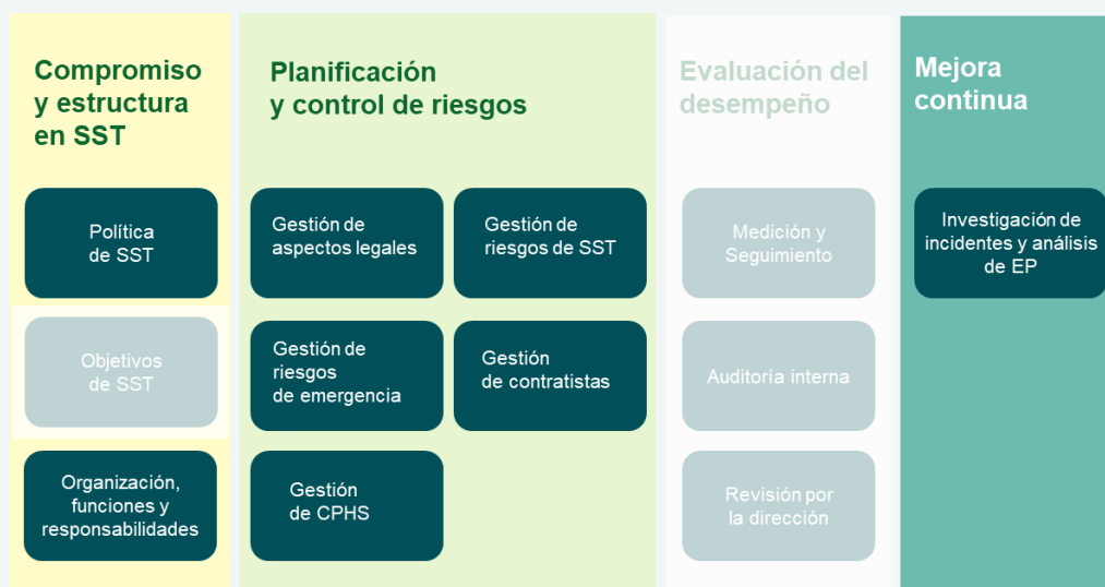
Ilustración 1: Procesos esenciales para optar a la Certificación de Gestión Normativa de la SST

Este nivel contempla doce procesos que se deben implementar para poder abordar de manera sistemática la gestión de SST.